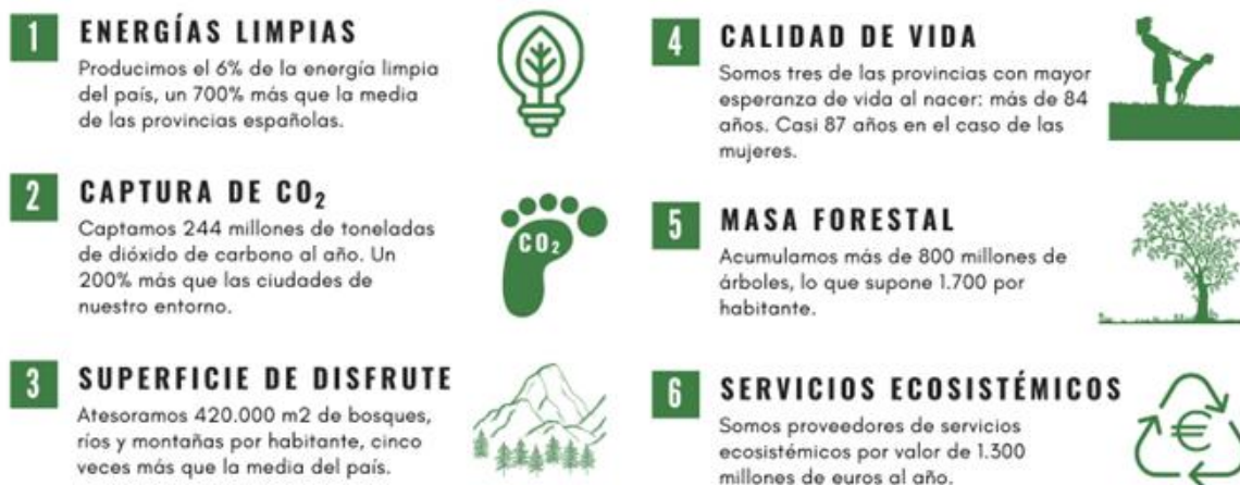
Figura 3. Parte del folleto “Territorios donantes de vida 3 ” realizado por la Red SSPA

Por tanto, en la legislación europea sobre la reducción de emisiones se debería tener en cuenta la situación particular de las provincias escasamente pobladas como Soria, Cuenca y Teruel. Incluyendo los siguientes puntos: