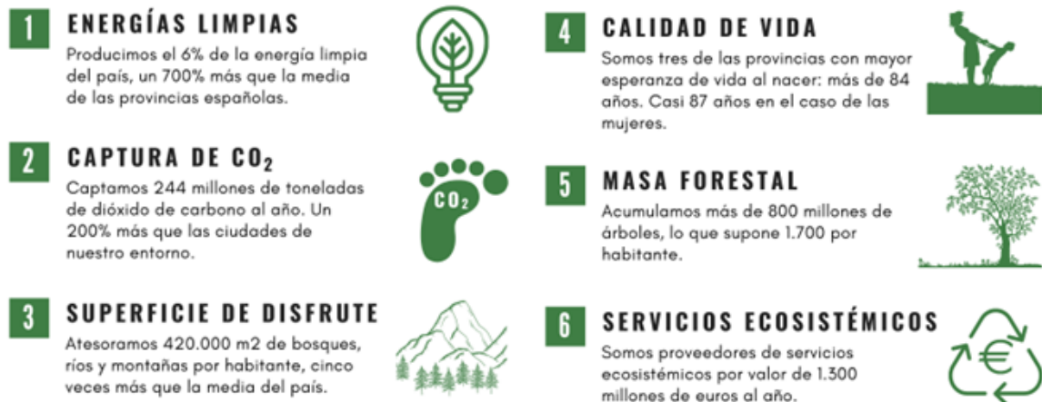
Figura 4. Parte del folleto “Territorios donantes de vida” realizado por la Red SSPA

b. Generar herramientas para medir el valor multifuncional de los territorios y de sus servicios ecosistémicos que permitan evaluar y cuantificar económicamente la contribución de los mismos, a fin de implementar compensaciones económicas objetivas. Además de evaluar y cuantificar económicamente su contribución, sería beneficioso vincular estos valores a programas de compensación económica. Por ejemplo, se podrían establecer mecanismos que permitan a las empresas compensar sus emisiones de carbono invirtiendo en proyectos de conservación de territorios con externalidades positivas.