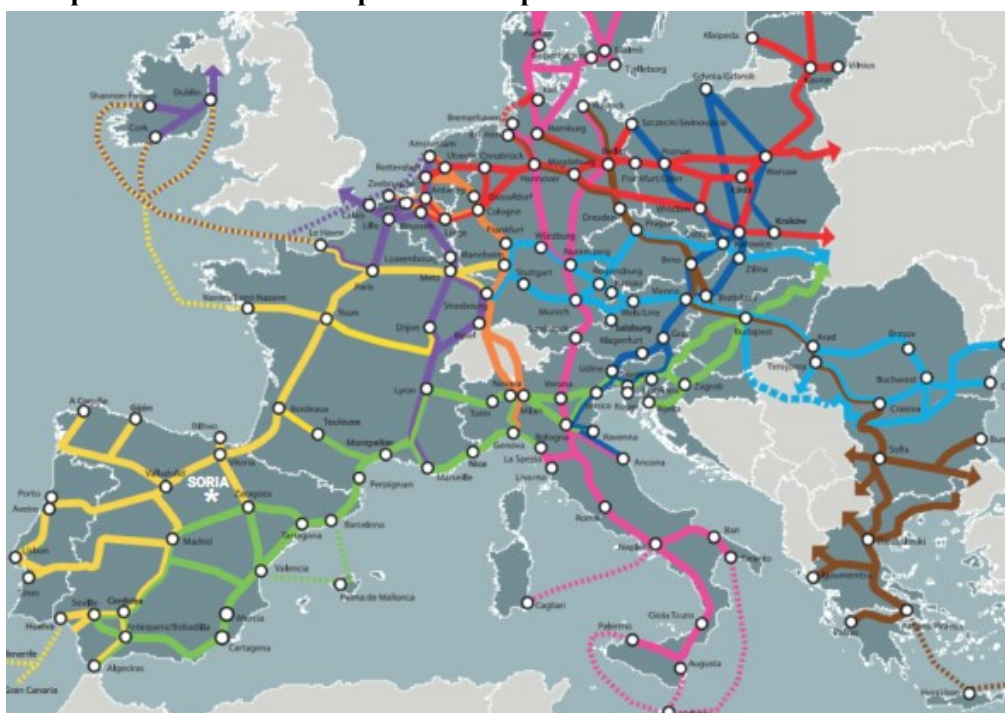
Figura 2. Mapa de la red Transeuropea de Transporte TEN-T